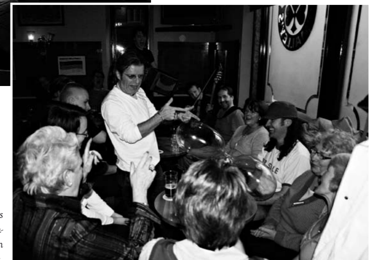
O'Malley's Irish Barissa juhlittiin myös Blackien syntymäpäivää. Bändin pojat lahjoittivat kaksi "ilmapalloa" ja koko pubillinen yleisöä lauloi päiväsankarille.