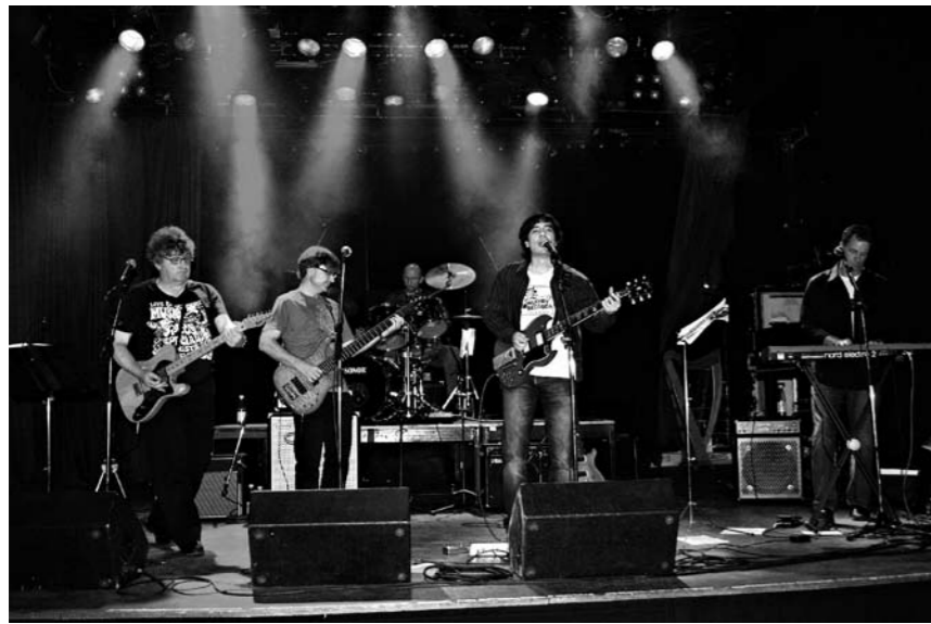
The Rackett Tavastian lavalla.