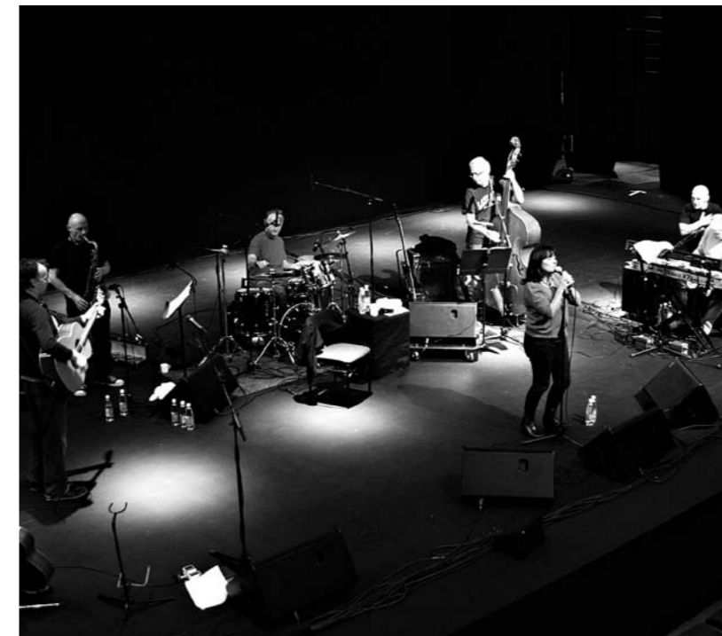
Soundcheck Vanajasalissa Hämeenlinnassa.