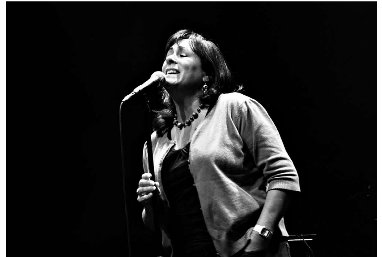
Tuntia ennen keikkaa.