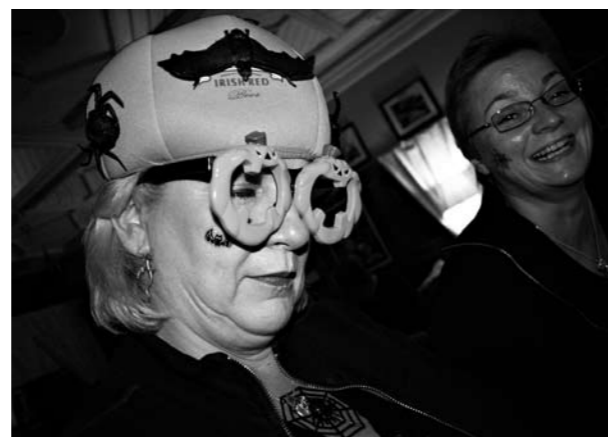
Suuri Kurpitsa oli noussut laseineen, lepakoineen ja hämähäkkeineen ja asettunut taloksi Tarjan päähän.