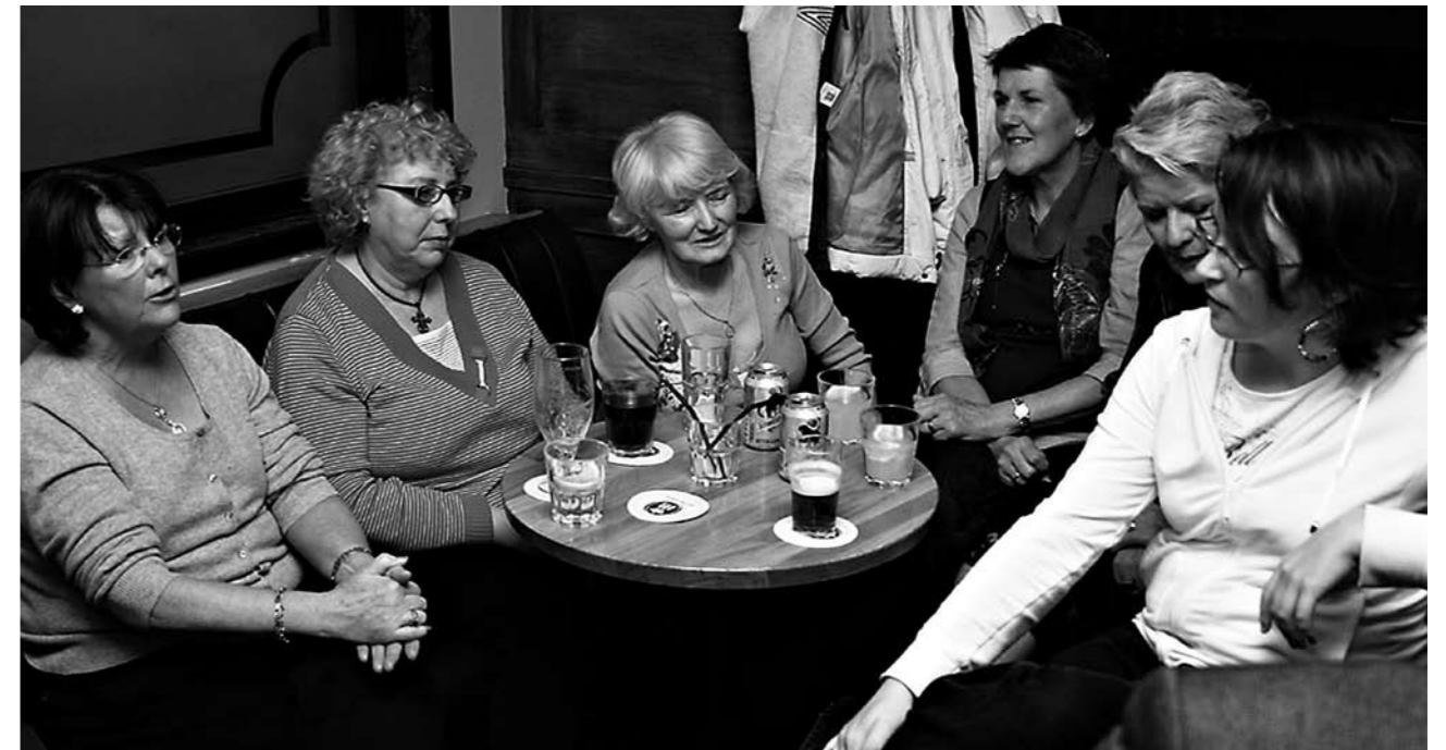
Jameihin oli tullut Irlannista asti tämä iloinen seurue, joka myös esitti muutaman kappaleen.