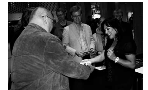
Nimikirjoituksen metsästäjiä oli Järvenpäässä jonoksi asti.