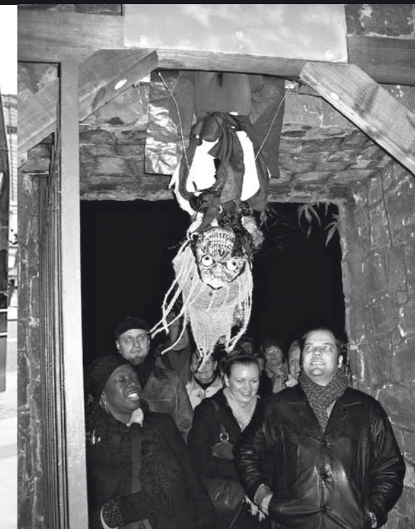
Ghost Busin kierros kestää yli kaksi tuntia, ja sen jälkeen tuntuu turvalliselta kävellä Dublinin ihmisvilinässä.