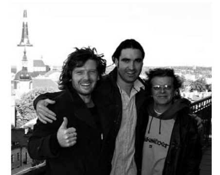
Keikkarupeaman jälkeen on vihdoin aika ottaa rennosti. Foolin in Doolin Tallinnan kattojen yllä.