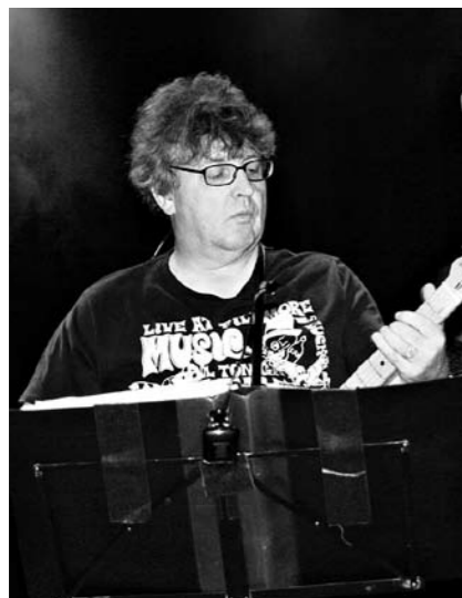
Kirjailija keskittyy soittamiseen.