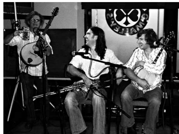
Foolin in Doolin sai eloa O'Malley's Irish Barin asiakkaisiin.