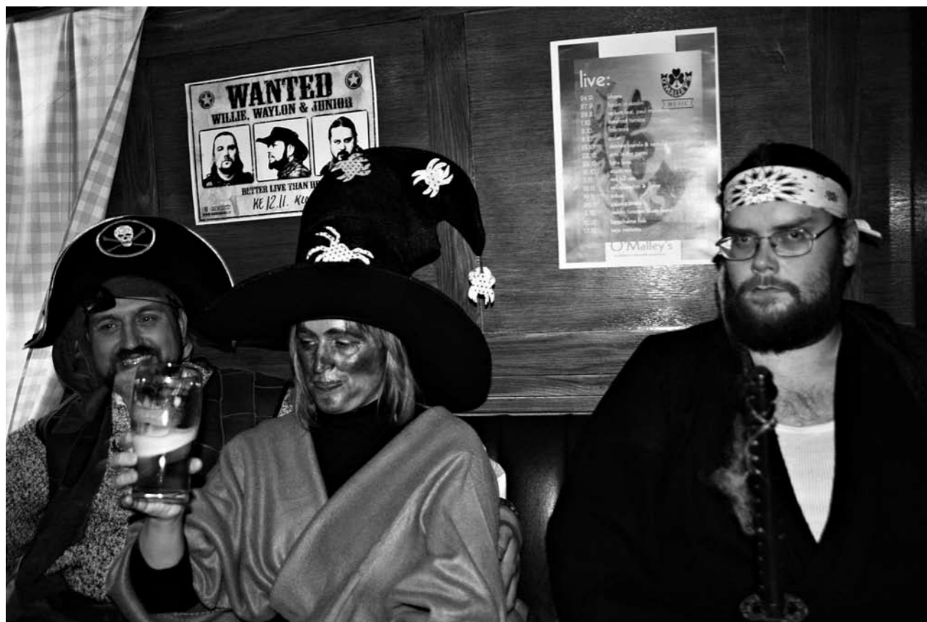
Perinteinen Halloween-ilta veti Mälliin merirosvon, noita-akan, viimeisen samurain ja paljon muuta pelottavan näköistä väkeä.