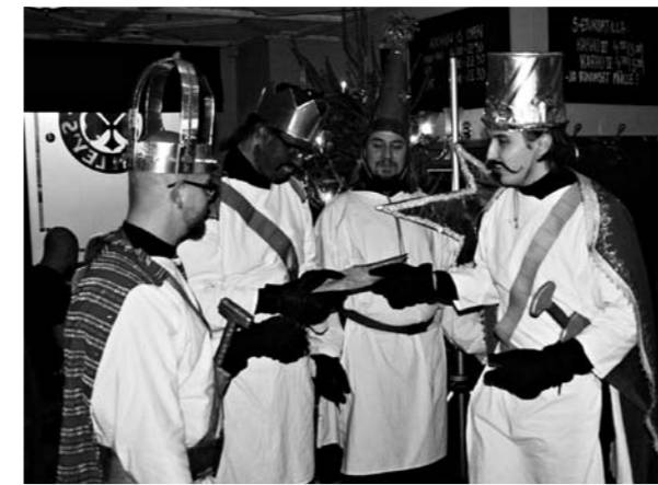
Tiemäpojat toivat tervehdyksensä O'Malley's Irish Barin pikkujouluihin.