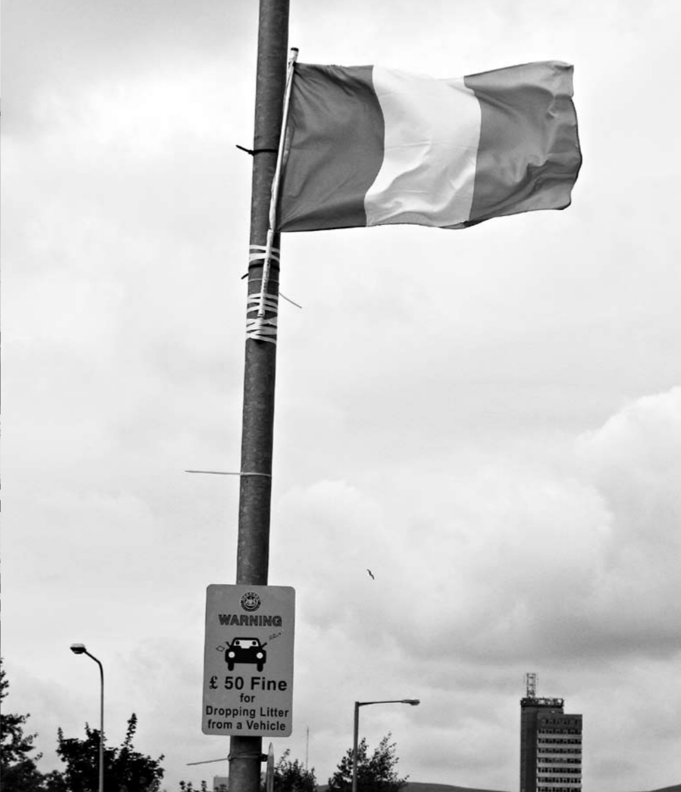
Katulamppuihin on teipattu Irlannin tasavallan lippuja, kun taas toisia alueita koristavat pitkänä nauhana liehuvat Union Jack –viirit.

Matkailijoille esitellään lähes ylppeydellä seinämaalauksia, joiden aiheina ovat esimerkiksi Boynen taistelun sankarit tai nälkälakoon ryhtynyt Bobby Sands. Maalaukset ja niiden tekstit kertovat karua kiel-