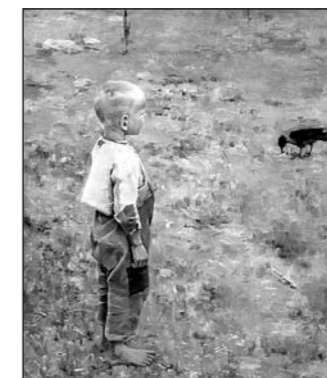
Poika ja varis

SUURIN OSA TÖISTÄ on peräisin Ateneumin taidemuseosta, jossa ne ovat näytteillä suurissa korkeissa 1800-luvun saleissa. Dublinissa niiden paikka oli ns. Millenium Wingissä, joka on moderni ja intii-