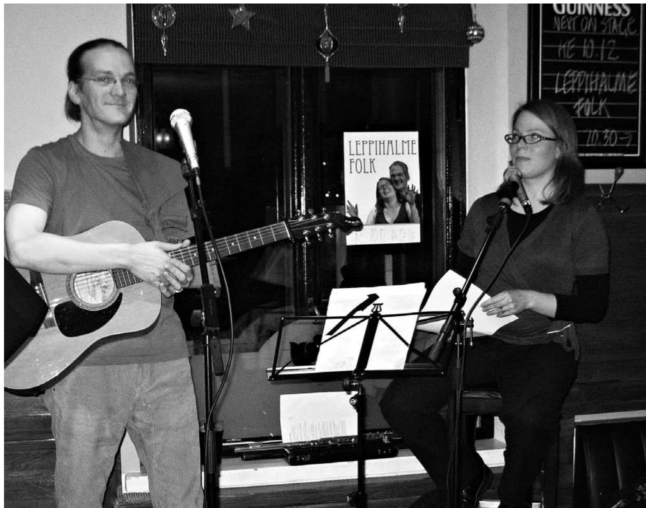
Pikkujoulujen musiikista vastasi Leppihalme Folk.