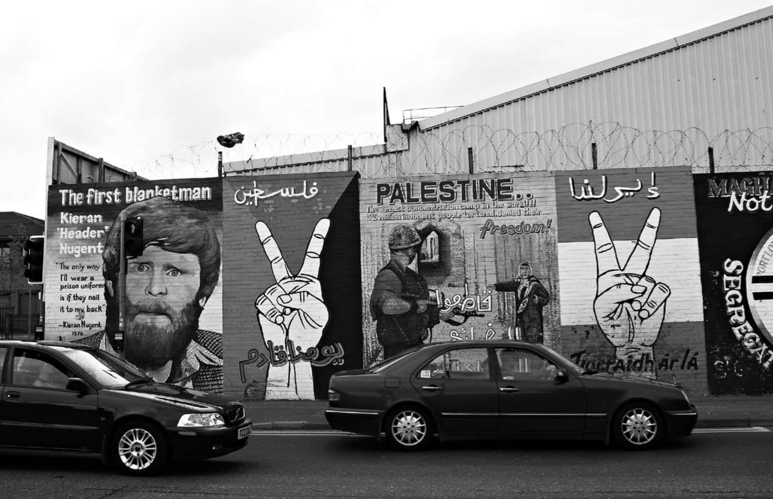
Belfastista löytyy seinämaalauksia, joiden aihepiiri kattaa lähihistorian lisäksi myös maailmanpolitiikan polttavimmat puheenaiheet.