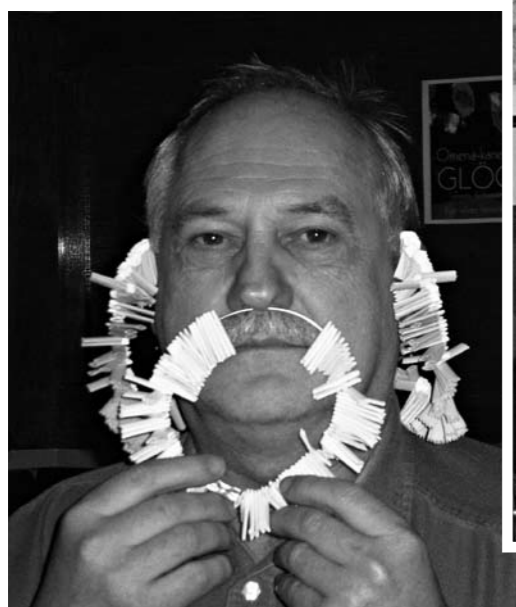
Pikkujouluissa pidettiin arpajaiset, joissa voittona oli mm. lentoja Irlantiin. "Ostaisitko tältä mieheltä arvan?"