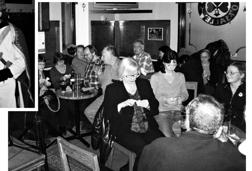
Pikkujouluyleisö nullaa arpojaan auki sormet jännityksestä vapisten.