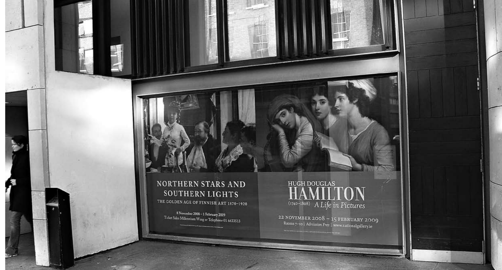
National Gallery Dublinissa on upea museo, joka joitain vuosia sitten tehdyn remontin jälkeen on entistä ehmpi.