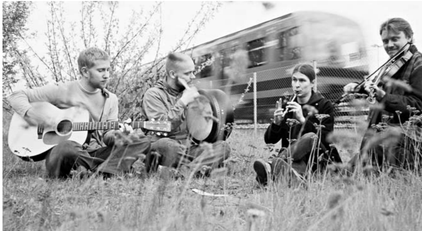
Pulari määrää St. Patric's Dayn tahdin.