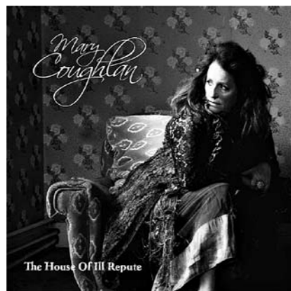
Mary Coughlan: The House of Ill Repute (Rubyworks RWXCD68)

Toivottavasti Mary Coughlan tulee pian jälleen Suomeen, sillä levy synnyttää riippuvaisuussuhteen tähän hienoon taiteilijaan. ♣