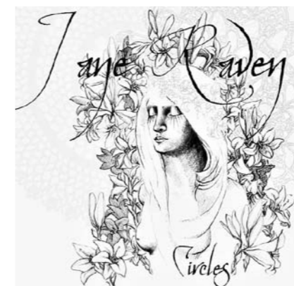
Jane Raven: Circles POMCD8001