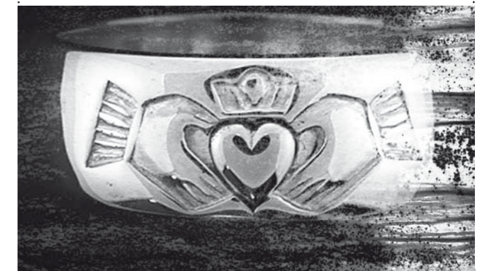
Leikkaa irti ja taita!

Haapavesi Folk Music Festival 25 -28 6 2009