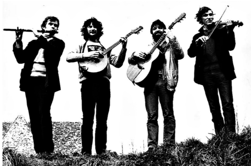
Bretanialainen Kornog tulee Haapavedelle.