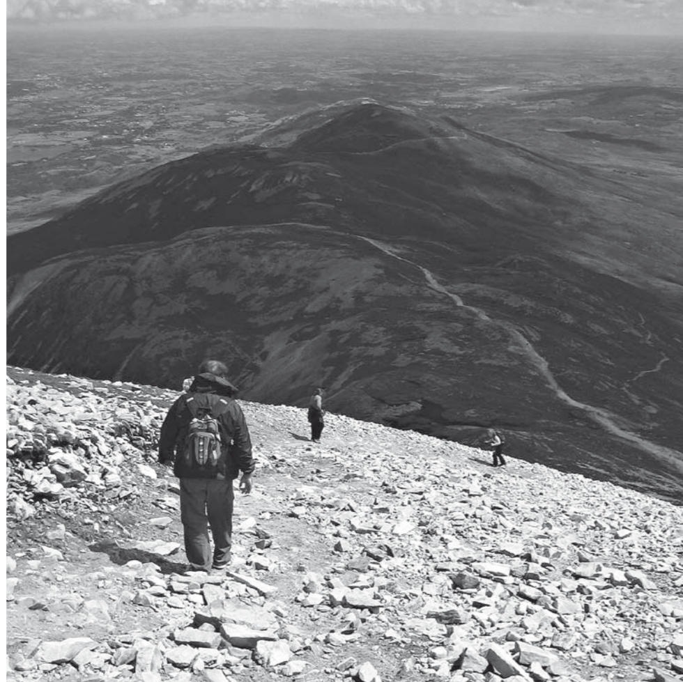
Vuoren ja koskemattoman ympäristön ansiosta lähialue elää kesäisin turismista.