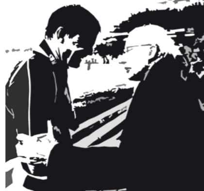
Ireland’s 2009 Grand Slam captain, Brian O’Driscoll shares a word with the hero of 1948 Dr. Jack Kyle

He lined it up, and millions held their breath, up it went, and up, straight as anyone (Welsh) could wish, but then it started to drop, and drop, and under the bar! And then finally! The Irish fullback caught it,