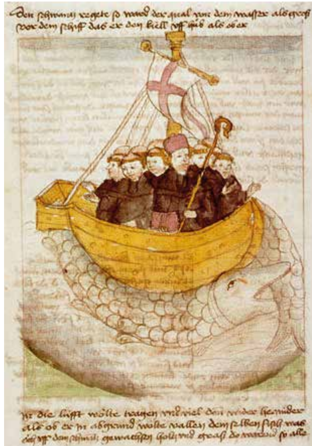
Brendan kalan selässä saksalaisessa keskiaikaisessa käsikirjoituksessa.

le, josta löytävät ravintoa. Joskus saarella kasvaa syötäviä hedelmiä tai eläimiä, saaren asukkaat voivat myös ruokkia matkalaisia tai sieltä saattaa löytyä autio talo, jossa on juhla-ateria odottamassa nälkäisiä kulkijoita. Tarinan lopussa matkailijat usein palaavat Irlantiin vain huomatakseen, että aika siellä on kulunut eri tahtiin ja kaikki heidän tuntemansa ihmiset ovat jo kuolleet. Joskus yksi matkalaisista astuu rannalle ja aika saa hänet kiinni; hän vanhenee silmän räpäyksessä ja kuolee saman tien.