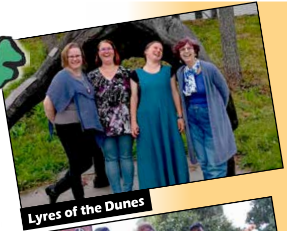
Lyres of the Dunes