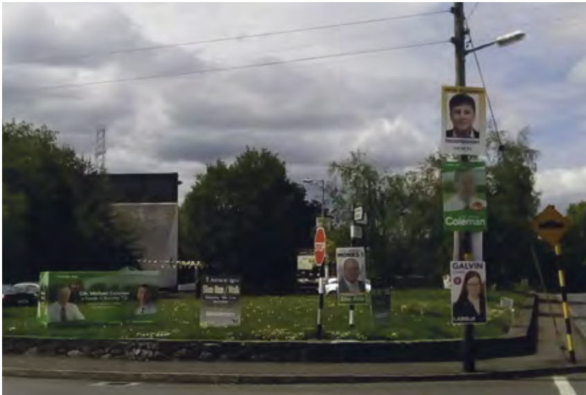
Irlannissa vaalit ovat henkilövaalit, Suomen vaalien tapaisia puoluekokonaisuuksia tai vaaliliittoja ei ole. Siksi mainontakin on ensisijaisesti henkilöiden mainontaa. Vaalien alla mainoksia on kaikkialla, missä ihmisiä liikkuu, paljon enemmän kuin Suomessa.

Asemansa juuri jättänyt pääministeri Leo Varadkar , hän jatkaa vt. pääministerinä, on hoitanut työnsä ilmeisen hyvin. Hän onnistui estämään tullirajan synnyn Irlannin saarelle, mikä oli erinomainen diplomaattinen saavutus. Raja syntyi sen sijaan Irlannin merelle, Ison-Britannian keskelle. Varadkaria piti auttaa sekin, että Irlannin talous on hyvässä kunnossa ja työttömyys matala. Irlanti on kasvanut EU:n keskiarvoa nopeammin vuodesta 2014 alkaen. Äänestäjille tämä ei kuitenkaan vielä riittänyt.