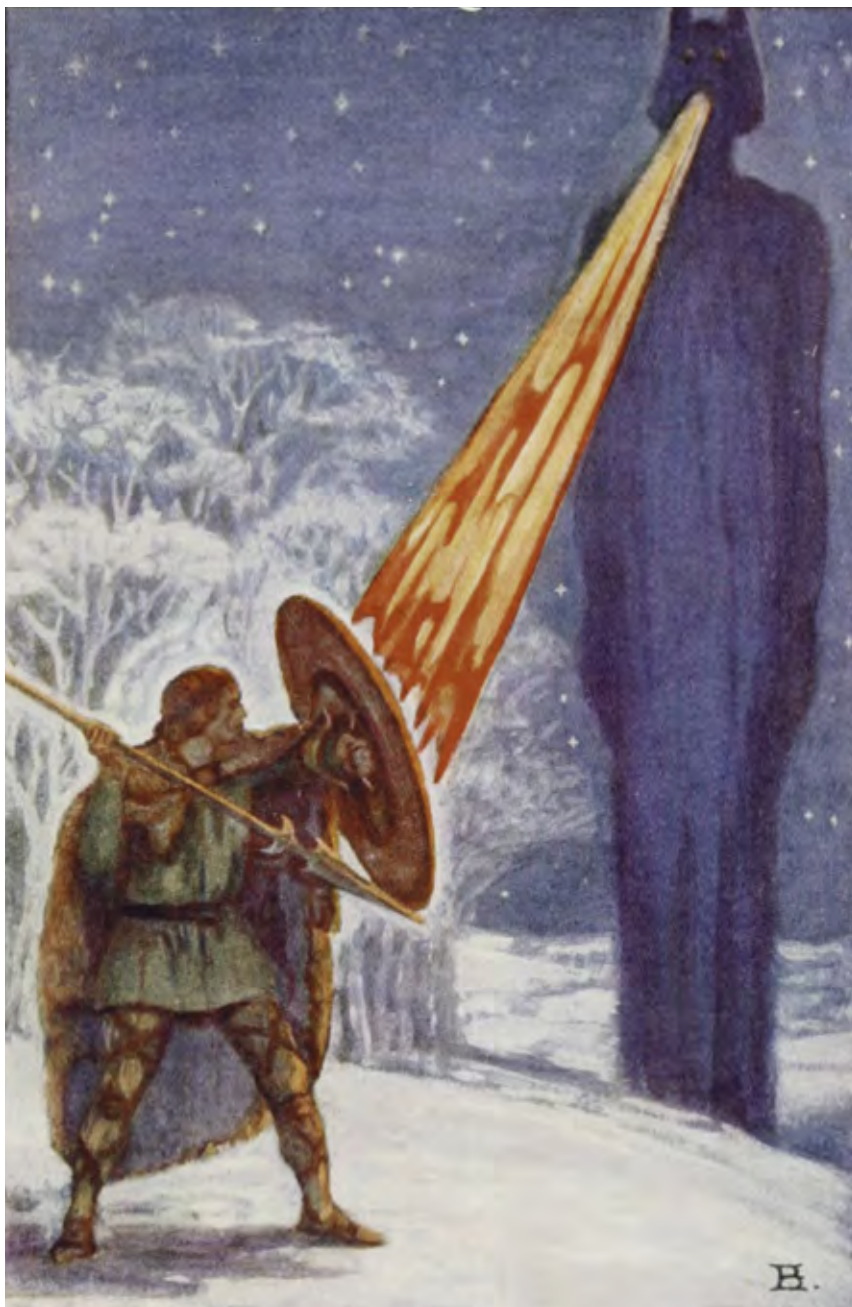
Legendaksi ei pääse, ellei ole muita olennaisesti paitsi vahvempi, myös etevämpi. Fionn onnistui voittamaan taistelussa Taraa vuosittain Samhainin aikaan terrorisoineen Aillénin oveluudellaan. Tulen syöksemisestääkään ei ollut apua Fionnia vastaan. (Tekijät Violet Russell ja Beatrice Elvery).

Ulsterin sykli kertoo soturi Cù Chulainnin uroteoista, joista kirjoitin Shamrockin numerossa 1/2019. Mytologinen sykli puolestaan kuvaa yliluonnollisia voimia omaavan Túatha Dé Danaan -kansan saapumista Irlantiin ja taistelua hirviömäisiä fomorialaisia vastaan ennen nykyirlantilaisten esi-isien tuloa saarelle. Nämä tarinat liittyvät läheisesti Lebor Gabála nÉrenn -teoksessa eli Irlannin valloitusten kirjassa esitettyihin tapahtumiin, joista kerroin jo Shamrockin numerossa 2/2019.