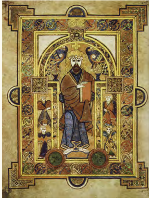
The Book of Kells lienee heinoin länsimaisen kalligrafian saavutus. Kirja on neljän Uuden Testamentin kirjan - ja joidenkin aputekstien - uskomattoman detaljikas esitys. Kirja on nykyisin esillä Trinity Collegen kirjastossa, Dublinissa.

680-sivuinen, aivan uskomattoman yksityiskohtaisen kuvituksen sisältävä kirja on nykyisin Dublinissa Trinity Collegen kirjastossa ja osia siitä on jatkuvasti näytteillä.