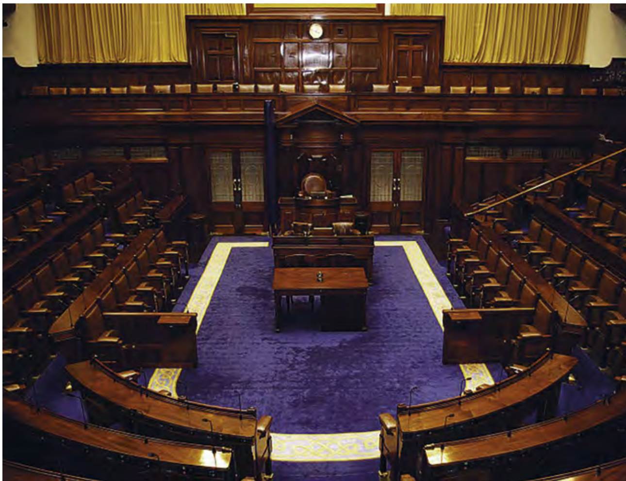
Irlannin parlamentin alahuoneen eli Dailin kokoontumistilat ovat juhlalliset, kuten maan tärkeimmälle poliittiselle näyttämölle kuuluukin. Senaatin merkitys on olennaisesti vähäisempi - eikä sitä valita vaaleilla, nimittämällä pikemminkin.

tapana, jopa parempana kuin meidän D'Hontdin systeemiämme, jossa puolueiden ehdokkaiden saamat äänet lasketaan yhteen ja sitten jaetaan paikat näiden mukaan. Kannattaa muistaa, että meillä noudatetaan yhtä matemaattista mallia tästä vaalitivasta ja muitakin olisi valittavissa, jos niin päätettäisiin.